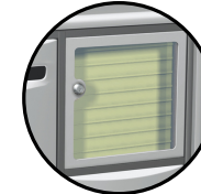
Tableau d'affichage incorporé