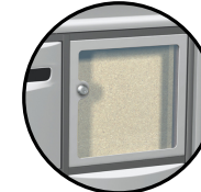
Tableau d'affichage nominatif