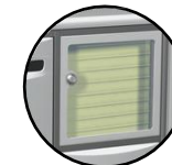
Tableau d'affichage nominatif