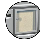
Tableau d'affichage incorporé