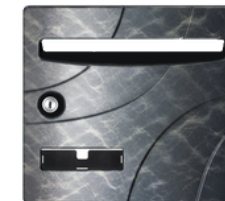
300 Gris médium