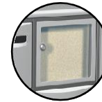
Tableau d'affichage incorporé