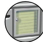
Tableau d'affichage nominatif